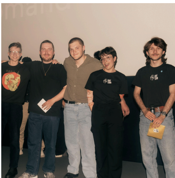
IMAGES 5 & 6. Les lauréats des prix de l'édition 2024.