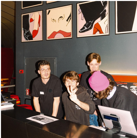
IMAGES 1 & 2. Les membres de l'association en action.